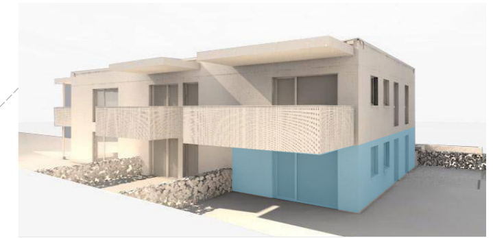
lage im gebäude